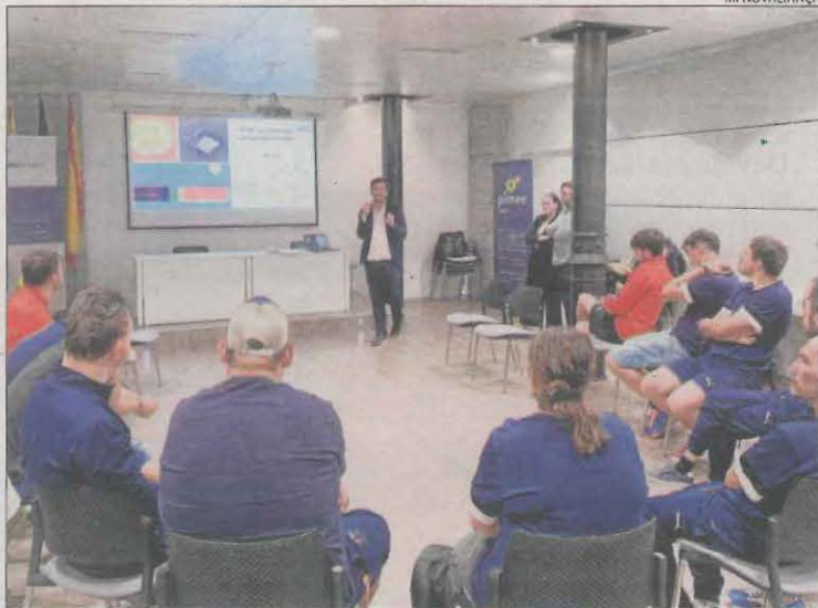
El taller de Mi NovAliança amb jugadors de l'Atlètic Lleida Genuine.