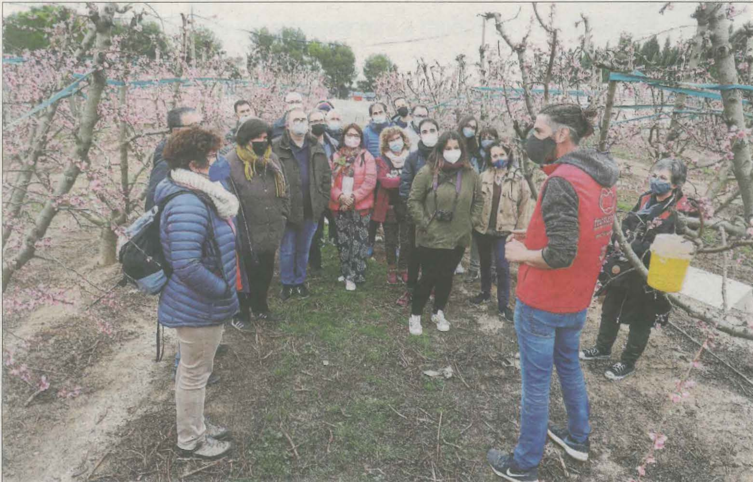
Imatge d'arxiu d'un grup de turistes visitant la floració dels arbres fruiters a Aitona.

Lleida busca desestacionalitzar el turisme i divulga atractius com la floració i la brama del cérvol