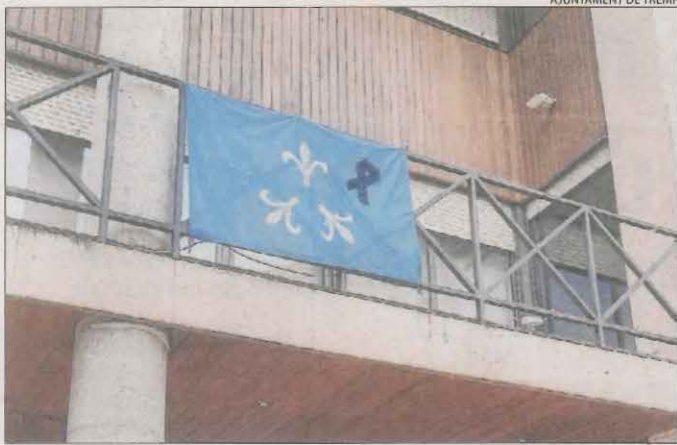
Crespó negre a l'ajuntament de Tremp en senyal de dol.