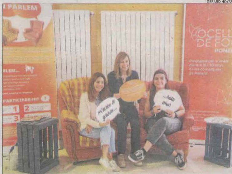
La instal·lació estarà tota la setmana al Campus de Cappedont.

BARCELONA | Un estudi de la Universitat Autònoma de Barcelona i de l'Institut de Investigació Biomèdica de Girona revela que els adolescents que consumeixen una quantitat més alta d'aliments i begudes ultraprocessades presenten més problemes psicosocials. L'anàlisi s'ha fet sobre mig miler d'adolescents espanyols d'entre 13 i 18 anys.