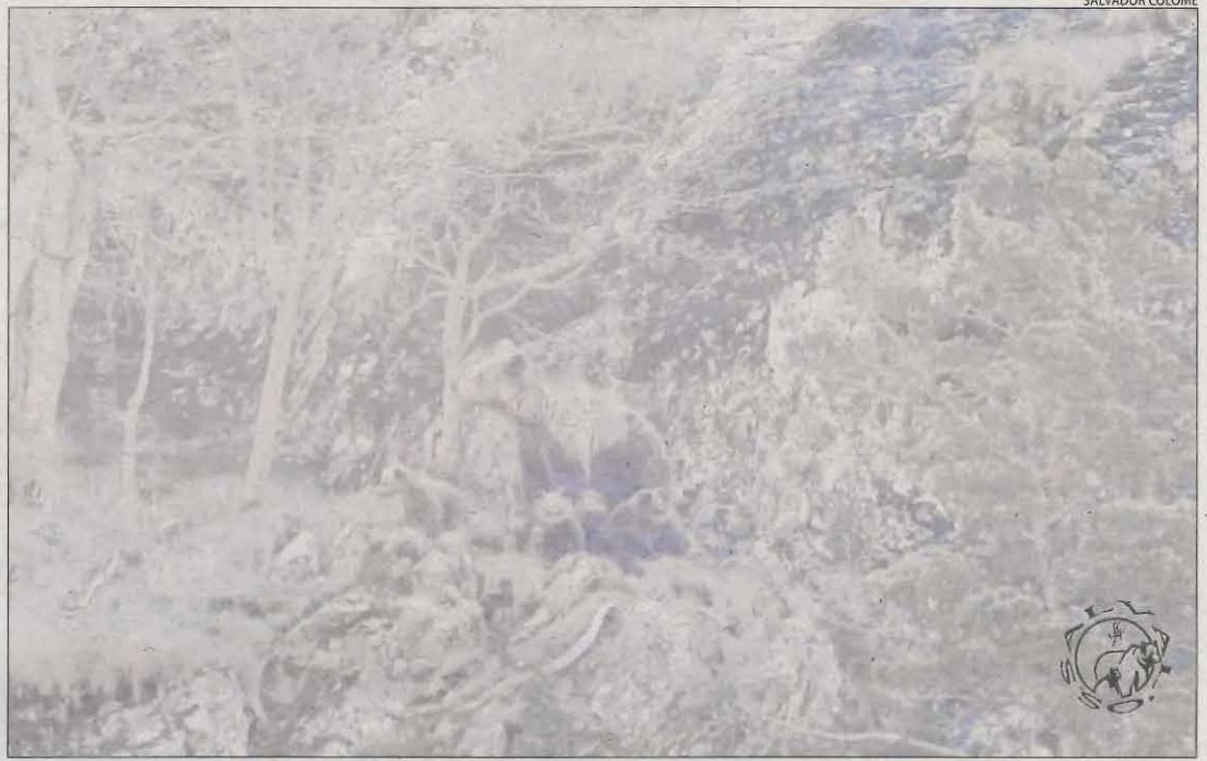
Fotograma d'una ossa amb tres cadells al municipi de Lladorre.